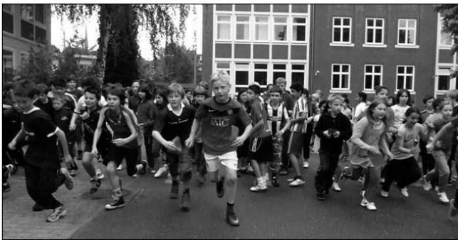
Sponsored Walk 2010