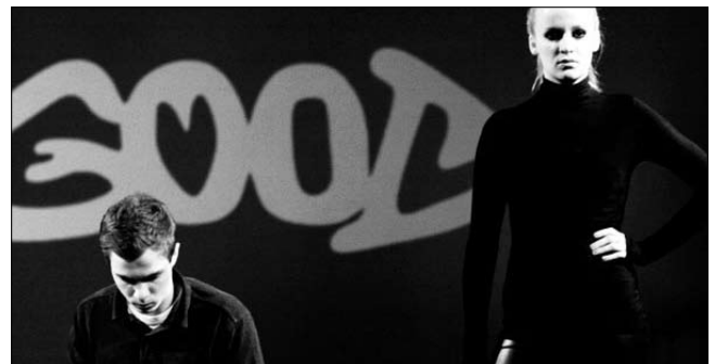
Ab Klasse 10 wird Theater als Wahlpflichtkurs angeboten