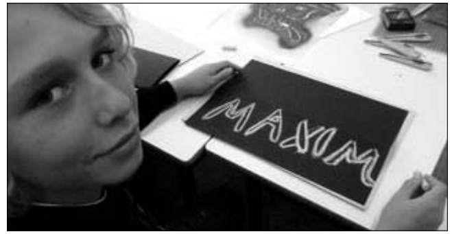
Als erstes entsteht ein Tag