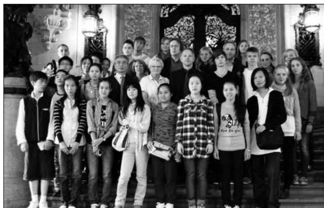
Die Gäste aus unserer Partnerstadt Shanghai wurden im Hamburger Rathaus herzlich begrüßt