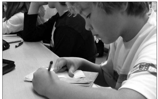
Er schreibt das Protokoll