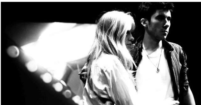
Die Aufführungen der Theaterkurse sind ein Highlight des Schuljahres