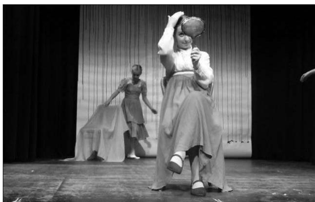
Aufführung der Theater-AG der 7. Klassen: „Das zweite Mädchen“. Buch, Regie, Kostüme und Bühne: Merle Hassner, S3

Umweltschule / internationale Agenda 21-Schule: Wir engagieren uns über den Unterricht hinaus für nachhaltige Entwicklung. Im Nachmittagsprogramm werden für die Beobachtungsstufe zwei Umwelt-AGs angeboten.