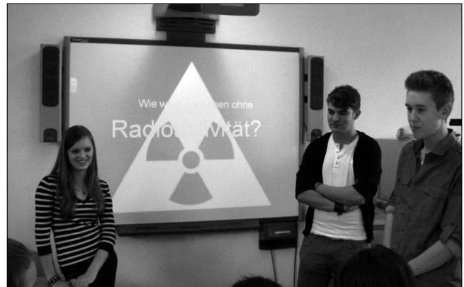
Die 10. Klasse präsentiert Ergebnisse ihres naturwissenschaftlichen Projekts