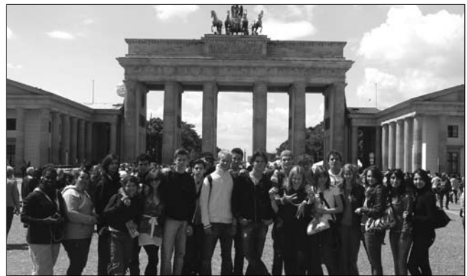
In alle Profilen finden Exkursionen statt

Im Profil „Natur und Umwelt“ stehen die ökologischen Herausforderungen mit den Themen Nachhaltigkeit, Energie und Innovationen im Vordergrund. Moderner naturwissenschaftlicher Unterricht verbindet die Fächer Biologie, Geographie und Chemie. Mit jedem Semester wechselt die fächerübergreifende Problemperspektive. Naturwissenschaftliche Arbeitsmethoden wie Experimente, Simulationen und Exkursionen stehen methodisch im Mittelpunkt. In allen Profilen finden Exkursionen statt.