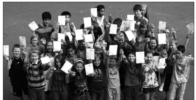
Die Teilnehmer des Wettbewerbs Känguruh der Mathematik machen immer wieder große Sprünge