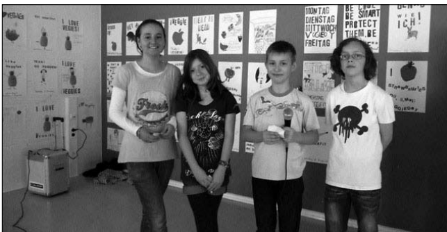
Poetry-Slam am Veggieday