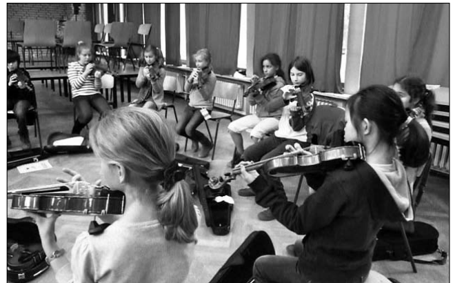
Gerade neu eingerichtet und schon stark nachgefragt: die Streicherklasse

Außerdem kann die Klassenratsstunde für gemeinsame Unternehmungen genutzt werden, z.B. zum Aufsuchen außerschulischer Lernorte.