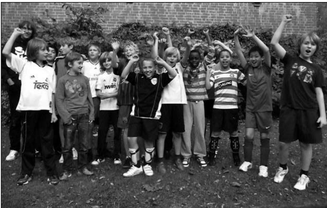
Unsere Schulmannschaft Fußball Jungen Klasse 5/6. Immer bereit, alles zu geben

Während die Schüler der Beobachtungsstufe ihre Mittagspause nach der 6. Stunde und also vor den Nachmittagsangeboten haben, liegt die Mittagspause der 7. bis 10. Klassen schon nach der 5. Stunde. Diese Pause kann je nach den individuellen Bedürfnissen dazu genutzt werden, zu Mittag zu essen, sich beim Sport auszutoben, Musik zu hören, für eine Klassenarbeit zu üben und Hausaufgaben zu bearbeiten, in der Bibliothek in Ruhe zu lesen, am PC zu recherchieren oder einfach den Kontakt zu Freunden zu pflegen. In unserer Schulkantine werden neben Brötchen, Snacks, Salaten usw. täglich auch zwei warme Gerichte angeboten.