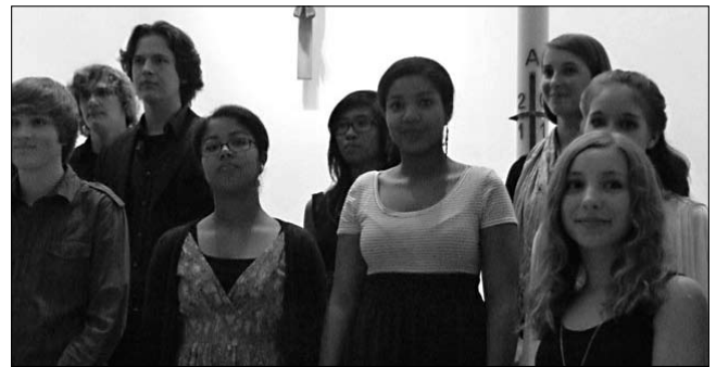
Der Chor des Gymnasiums Lerchenfeld beim Konzert in St. Antonius