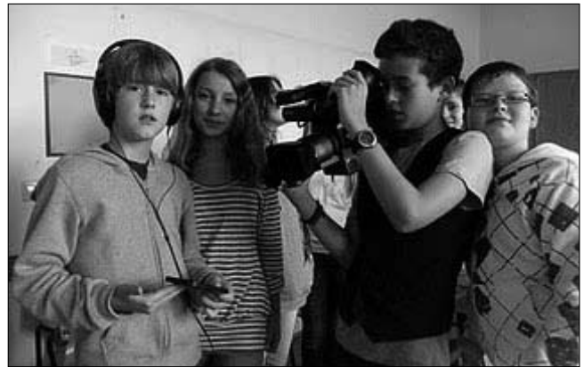
Teilnehmer des Film-Wettbewerbs Kid-WitnessNews

Ein verbindlicher Methodenlehrplan stellt sicher, dass neben den fachlichen Inhalten auch die Organisation des eigenen Lernprozesses („Lernen lernen“) auf allen Klassenstufen kontinuierlich eingeübt wird. Dazu gehören u.a. die richtige Vorbereitung auf Klassenarbeiten, Lesetechnik, Präsentation, Protokollieren und Recherche. So stellen wir sicher, dass unsere Schüler neben der fachlichen Kompetenz auch die so genannten Schlüsselqualifikationen (z.B. Analysefähigkeit, Denken in Zusammenhängen, Meta-Kognition, Ausdauer, Flexibilität) erwerben.