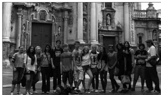
Die Austauschschüler des Gymnasiums Lerchenfeld vor der Kathedrale von Murcia

Ab 2012 bieten wir an, interessierte Schüler beim Erwerb des DELE-Diploms zu unterstützen. Dieses Angebot gilt für alle Spanisch lernenden Kinder.