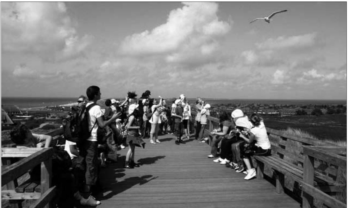
Eine schöne Tradition am Lerchenfeld: die Klassenfahrt nach Sylt im Jahrgang 6

Konzerte, Theateraufführungen, Sportfeste und unser Weihnachts-Flohmarkt sind Höhepunkte des Schuljahres, die mit viel Engagement und Freude ausgerichtet werden. Darüber hinaus nehmen unsere Schüler regelmäßig und mit Erfolg an zahlreichen Wettbewerben teil. Zum Beispiel Heureka, The Big Challenge, Jugend debattiert, KidWitnessNews, Rapido, der Bertini-Preis und das jährliche Schachturnier „Linkes gegen rechtes Alsterufer“.