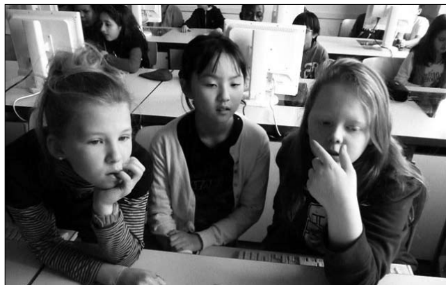
The Big Challenge: Schon in der 5. Klasse nehmen wir am Sprach-Wettbewerb teil

Seit 2010 bieten wir interessierten Schülern die Möglichkeit eines Austauschs mit der Ganquan Middle School in Shanghai. Zwei Wochen lang haben sie Gelegenheit, sich ein eigenes Bild von China zu machen. Das Leben in einer chinesischen Gastfamilie, der aktive Schulbesuch, zu dem auch die Teilnahme an gemeinsamen Umweltprojekten gehört, und die einzigartige Kultur hinterlassen bleibende Eindrücke. Unterstützt wird der China-Austausch von der Mercator-Stiftung.