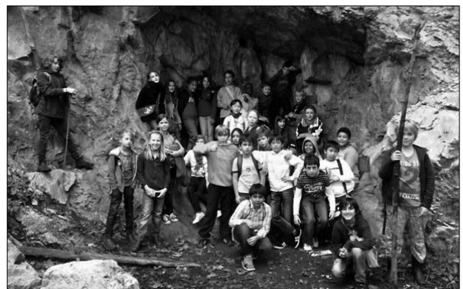
Klassenreise nach Bad Segeberg