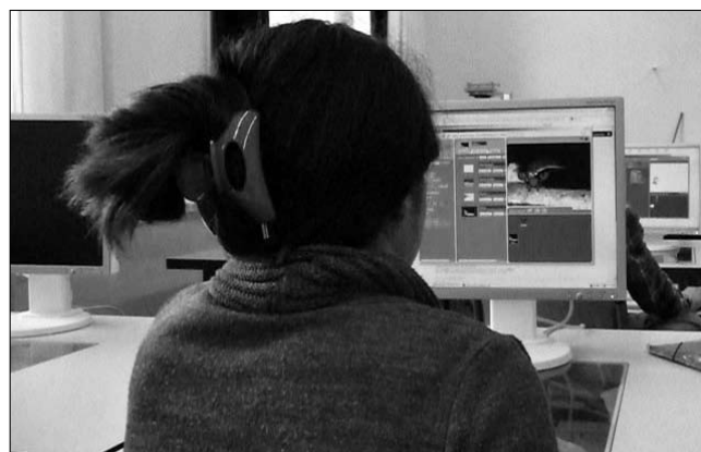
Viel spannender als Trickfilme kucken: Trickfilme selber machen