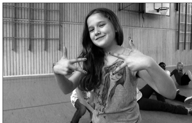
In die Hip Hop AG dürfen Schüler ihre eigene Musik mitbringen

Nach den pädagogischen Konferenzen im November bieten wir am Nachmittag je nach Bedarf und Möglichkeiten zusätzlich zum verbindlichen Förderunterricht gegen eine geringe Kostenbeteiligung auch Extraübungen in den Hauptfächern an.