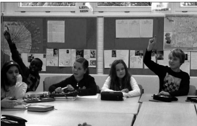
Klassenrat in der 5d