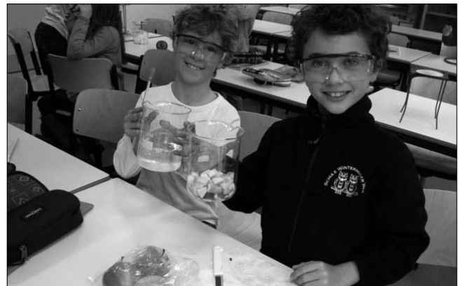
Chemie macht Spaß, wenn man weiß wie es geht