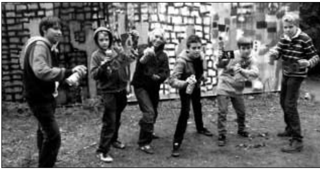
Graffiti-Projekt nur für Jungs